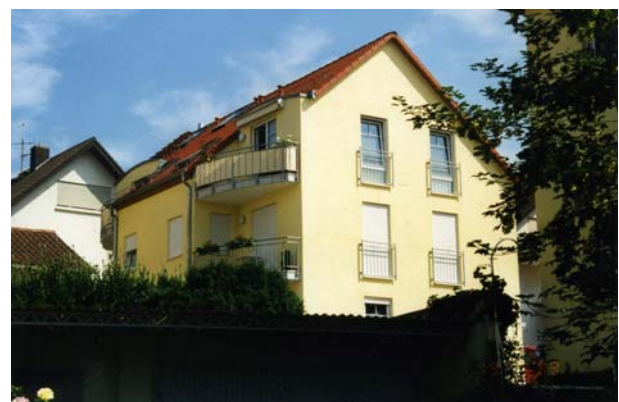
Ansichten des fertigen Hauses