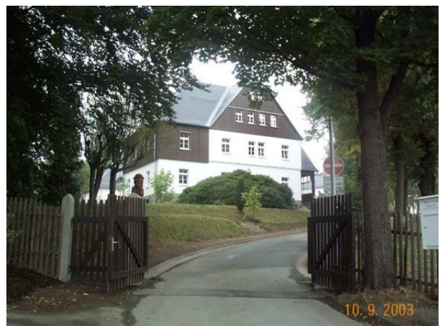
Ansicht nach der Sanierung