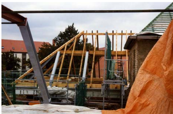
Einbau eines neuen Dachstuhls