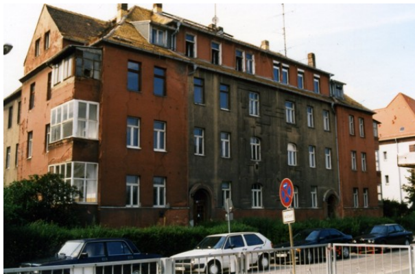
Ansicht vor der Sanierung und