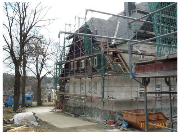
während der Sanierungsarbeiten