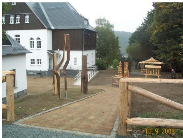
Außenanlagen nach der Sanierung