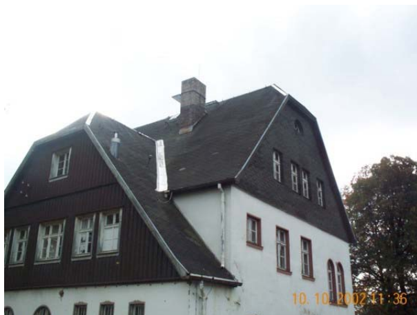
Bestandsaufnahme vor der Sanierung