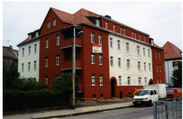
....nach der Sanierung