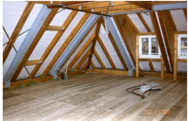
Ausbau Dachgeschoss für 3 neue Wohnungen