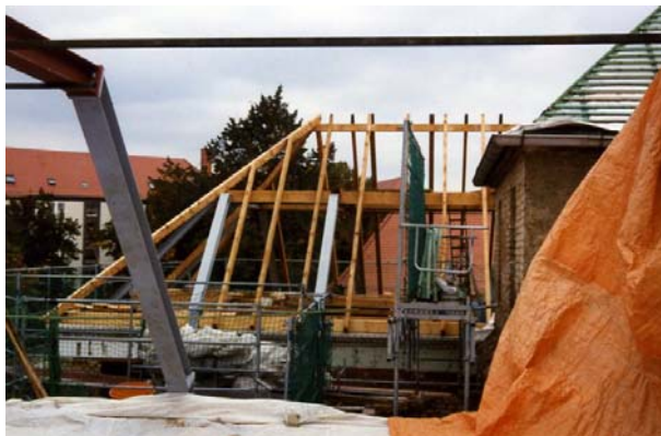
Einbau eines neuen Dachstuhls